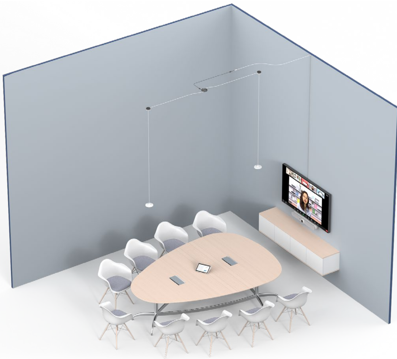
Figure 2 – Deux modules de micro avec supports de suspension. Les deux modules de micro sont connectés à un hub de module de micro, et ce dernier est connecté par une rallonge de module de micro Rally. Les modules de micro sont espacés de 2,4 mètres, avec le hub de module de micro au milieu pour maximiser l'utilisation du câble. Remarque: l'image n'est pas à l'échelle.

Pour toute configuration avec un support de suspension pour module de micro, une rallonge de module de micro Rally est recommandée. Sans cette rallonge, les options de configuration sont limitées, car les câbles du module de micro mesurent 2,9 mètres.