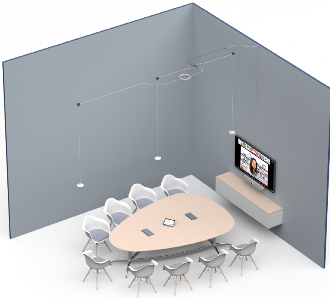
Figure 3 – Trois modules de micro avec supports de suspension. Les deux premiers modules de micro sont connectés à un hub de module de micro, et ce dernier est connecté par une rallonge de module de micro Rally à un système Rally Bar/Rally Bar Mini. Le troisième module de micro est connecté au hub de module de micro à l'aide d'une rallonge. Les modules de micro sont espacés de 2,4 mètres, et le hub de module de micro se trouve entre les deux premiers modules pour maximiser l'utilisation du câble. Remarque: l'image n'est pas à l'échelle.

Pour plus de deux modules de micro dans une configuration linéaire , vous aurez besoin de davantage de hubs de module de micro ou d'une autre rallonge. En effet, il n'est pas possible de connecter des modules de micro en série aux supports de suspension. Pour ajouter un troisième module de micro dans une configuration utilisant la RallyBar/Rally Bar Mini, vous pouvez utiliser une rallonge supplémentaire, comme représenté sur l'image ci-dessous. Pour un système Rally Bar avec quatre modules de micro suspendus, les troisième et quatrième modules devront être connectés à un deuxième hub de module de micro et une deuxième rallonge, respectivement. Si la salle est dotée d'un système Rally/Rally Plus, un hub de module de micro sera nécessaire pour chaque module de micro suspendu supplémentaire. En d'autres termes, pour deux modules de micro suspendus supplémentaires, deux hubs de module de micro seront nécessaires, et ainsi de suite.