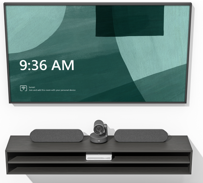
Logitech RoomMate avec Rally Plus